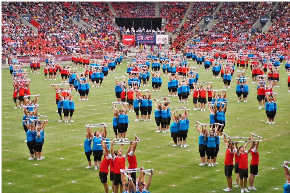
skladba Rocková symfonie

Presentovaly jsme Sokol Ořechov na místních sletech v Moravských a Nových Bránicích, v Telnicích, Řícmanicích, župním sletě v Olomouci, krajském sletě v Brně i Přerově.