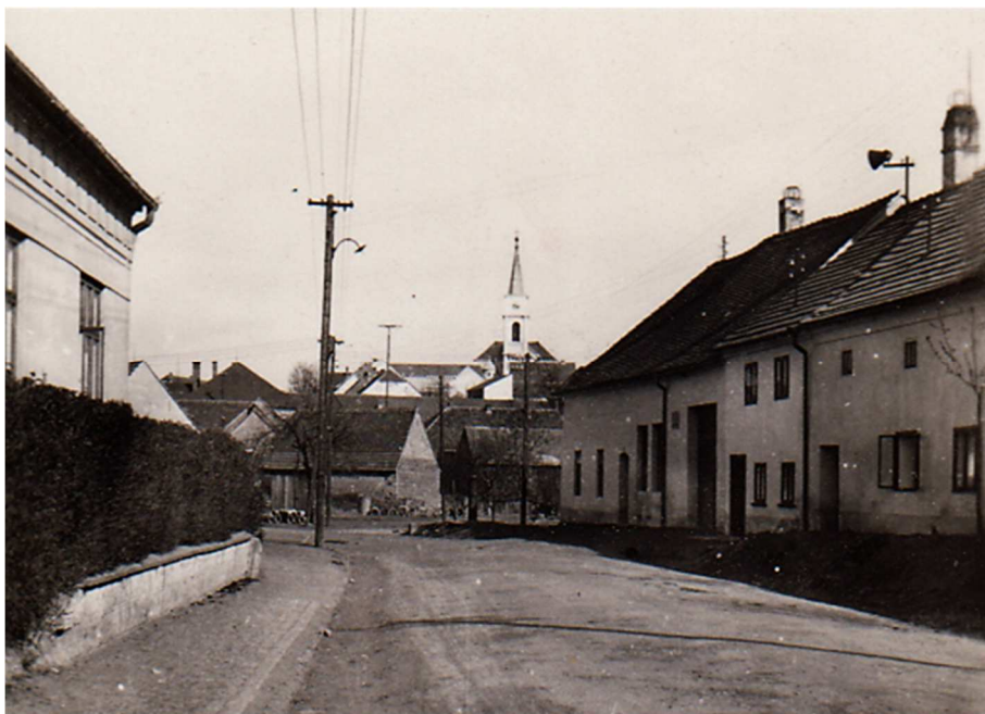
Na rohu ulic Pavlíkova a Kout byla za velkými vraty kovárna