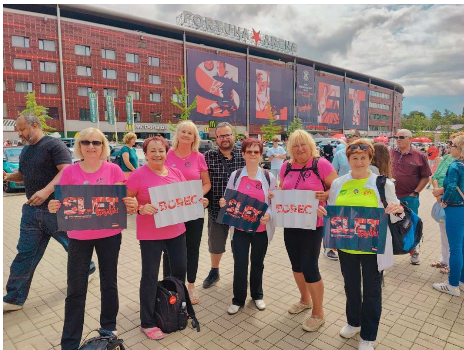
Členové Sokola v roli diváků