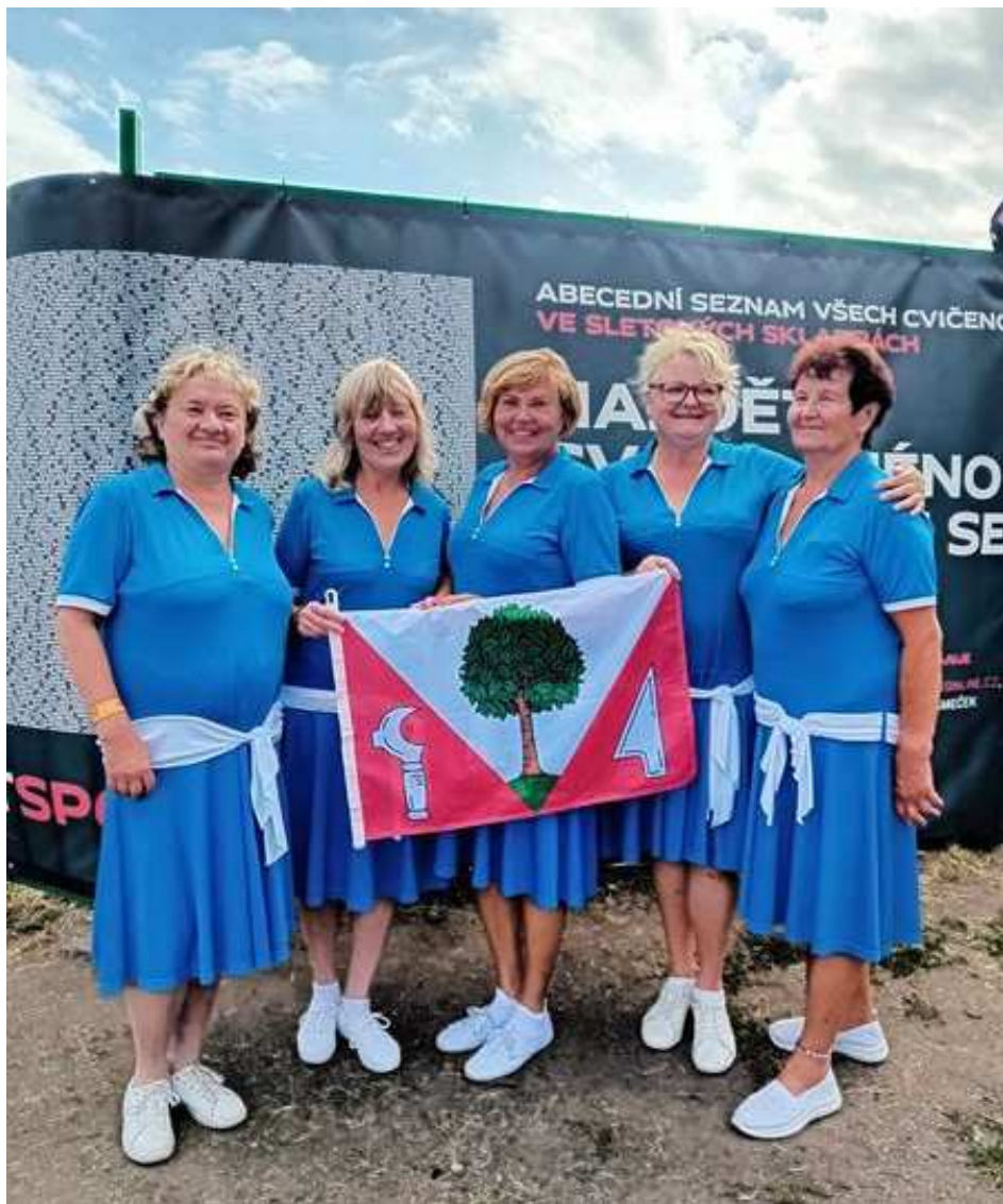
Cvičenkyně na XVII. všesokolském sletu v Praze