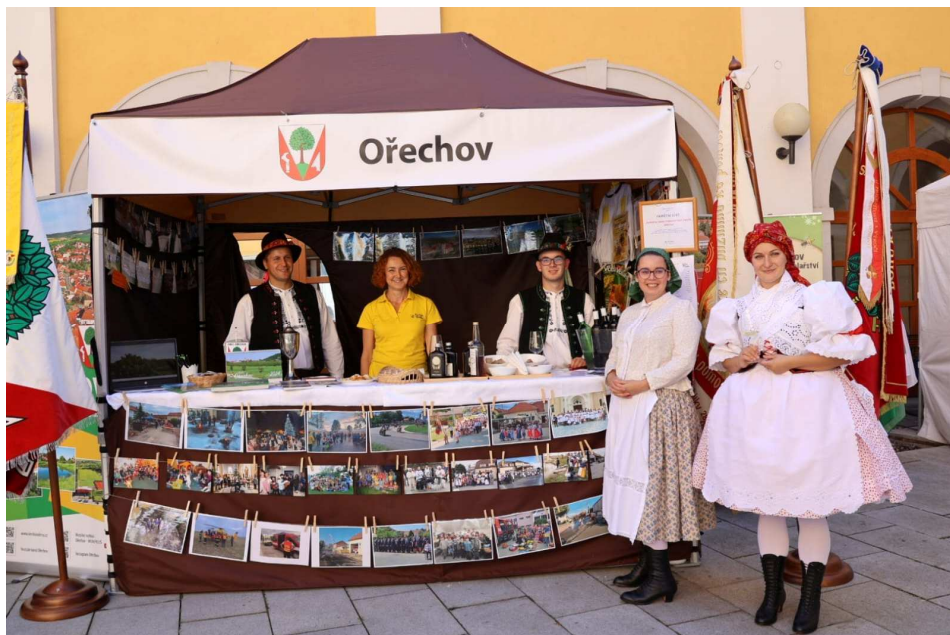
Prezentace naší obce na vyhlášení celostátních výsledků Vesnice roku v Uherském Hradišti