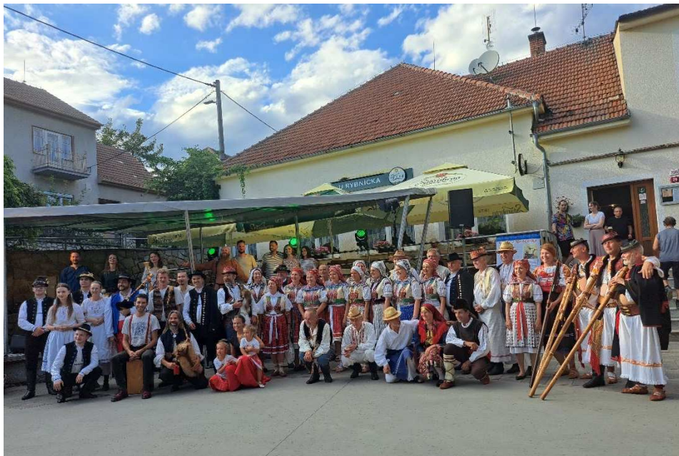
GajdeFest (nahore), prezentace zahrádkářů před komisí Vesnice roku (dole)