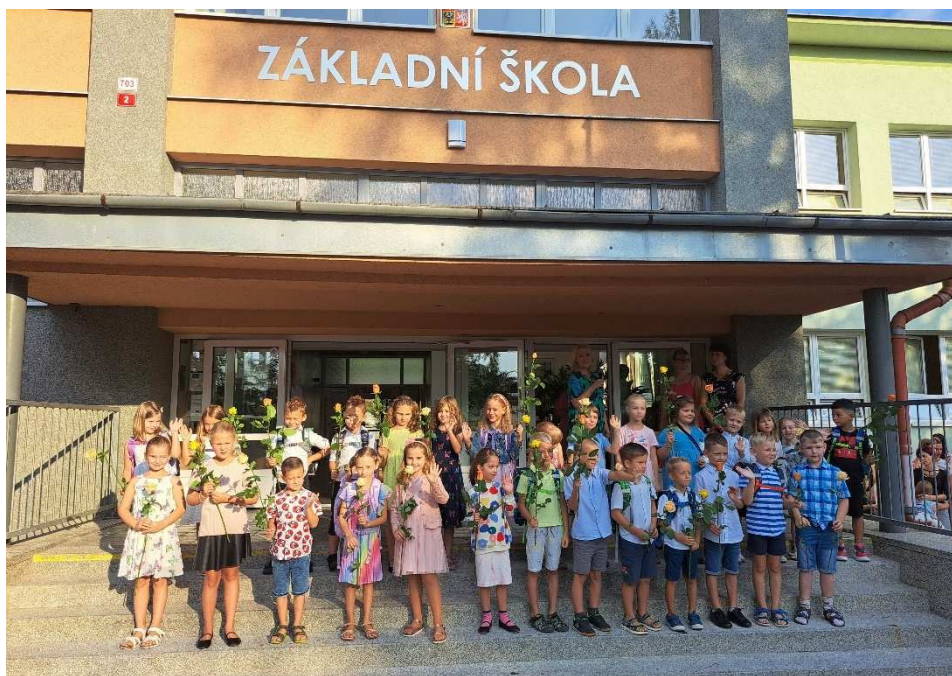
První školní den a nová specializovaná učebna cizích jazyků